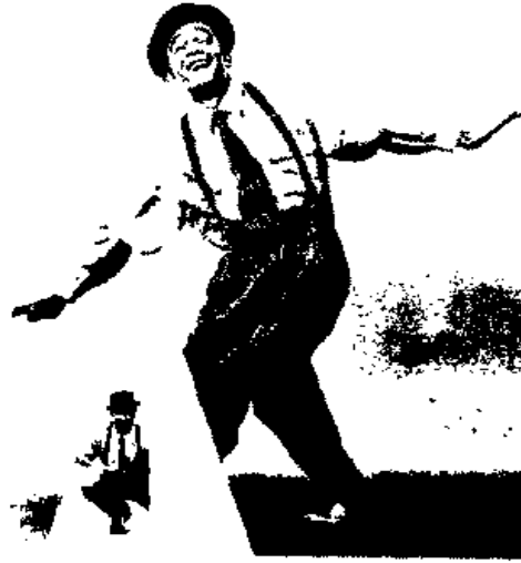
Photo 1. Top Dress C. Cap/Dress 1. Top Dress 2. Photo 2. Top Dress C. Cap/Dress 1. Photo 3. Top Dress 1. Cap/Dress 2.

© 1994 by the "Kreppel" Verlag, 11111 1st Street, N.W., Seattle, WA 98107. All rights reserved. Reproduction of this book is prohibited without the express written permission of the publisher. All rights reserved.