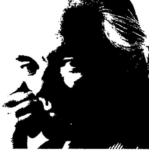
المؤلف توماس بيرنهارد

( يجب الاعتراف بأن عروض الافتتاح عادة ما تكون امتحاناً لا يطلق وسخرية من الفن ) .